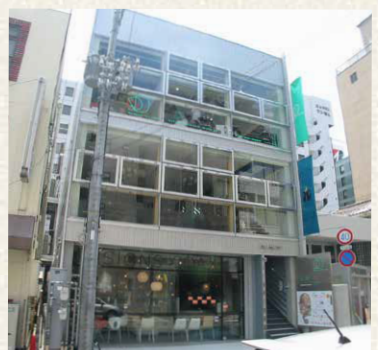
アルミナム/神戸市中央区