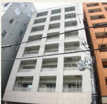
ベレッツァ/神戸市中央区