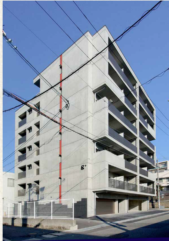
【神戸市中央区／鉄筋コンクリート造7階建／マンション／2014年3月竣工】 月極駐車場を開発した单身者向け賃貸マンション。優れた企画が生み出す収益性と、入居者に満足頂ける仕様を緻密にプランニングし、激戦の賃貸住宅エリアで高い稼働率を維持しています。