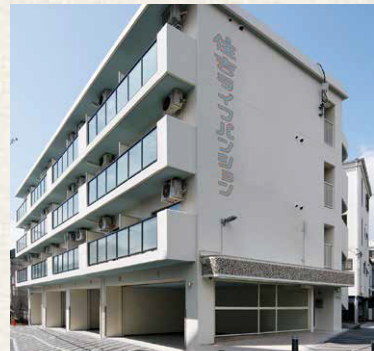
住吉ライフマンション / 神戸市東灘区