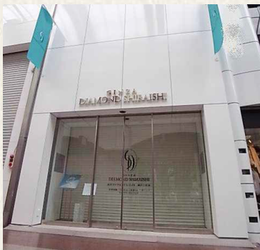
三宮MINAMIビル / 神戸市中央区