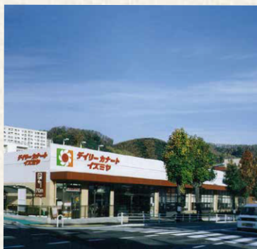
イズミヤデパート・カナル鴨越町店/神戸市兵庫区