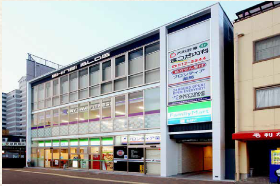
【神戸市兵庫区／鉄骨造3階建／テナントビル／2015年10月竣工】 地下鉄線の駅前遊休地をテナントビルとして開発。駅前立地の動線を活かした物販店舗、医療集積地域に基づくクリニック&調剤薬局等のマーケット・ニーズに合致したテナントミックスを実現しました。