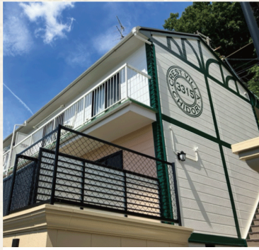
クレストヴィラ千鳥 / 神戸市兵庫区