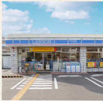
ローソン御幣島六丁目/大阪市西淀川区