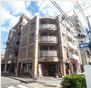
リバティ永沢 / 神戸市兵庫区

当社の基盤事業であり、永年にわたる確かな実績には大きな自負があります。マンション、テナントビル、ロードサイド等の様々な不動産を、神戸市内を中心に保有。対象となる不動産の特性を最大限に引き出し、経済価値を高めることに尽力しています。