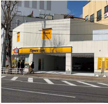
多間通店舗 / 神戸市中央区