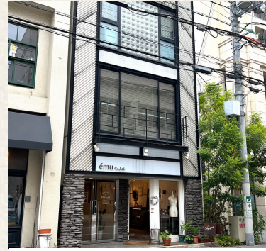
SPCビル / 神戸市中央区