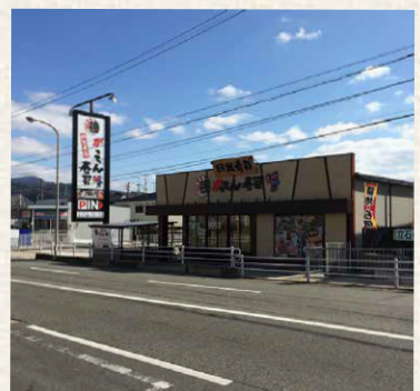
グルメ回転寿司・がってん寿司(旧かっぱ寿司)/神戸市兵庫