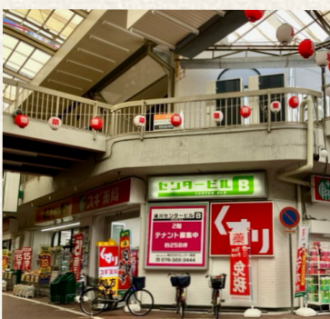
湊川センタービルA棟・B棟/神戸市兵庫区