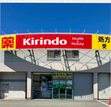
ドラッグストア・サーバ兵庫鴨越店/神戸市兵庫区