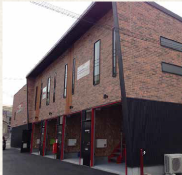
ひよどり越町ライゼボックス / 神戸市兵庫区