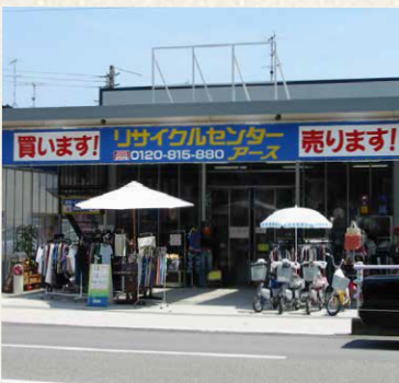
リサイクルショップ・アース/神戸市兵庫区