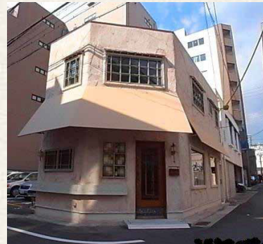
アルミナムII / 神戸市中央区