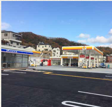
セルフ夢野SS・ローソン神戸夢野 / 神戸市兵庫区