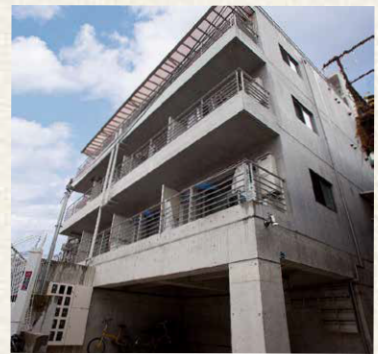
神戸・山手アパートメント/神戸市中央区