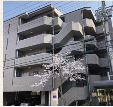
メゾン・ド・ヴィレ須磨潮見坂 / 神戸市須磨区