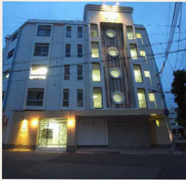
神戸湊アパートメント/神戸市兵庫区