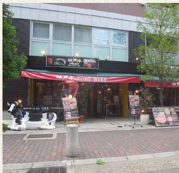
ワコーレ元町ザ・シティ / 神戸市中央区(区分)