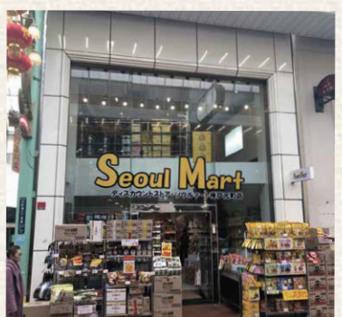
MINAMI元町ビル/神戸市中央区