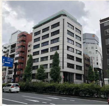
芝大門116ビル / 東京都港区(区分)