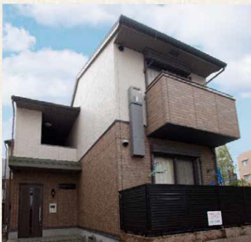
アルバビエント/神戸市灘区