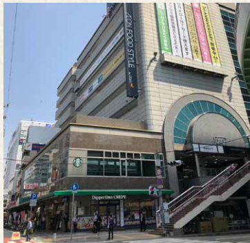
サンシティ / 神戸市中央区(区分)