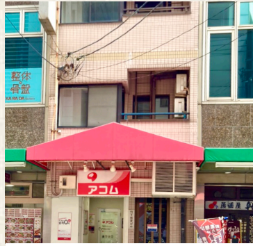
雲井ビル / 神戸市中央区