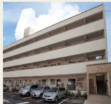
夢野アパートメント / 神戸市兵庫区